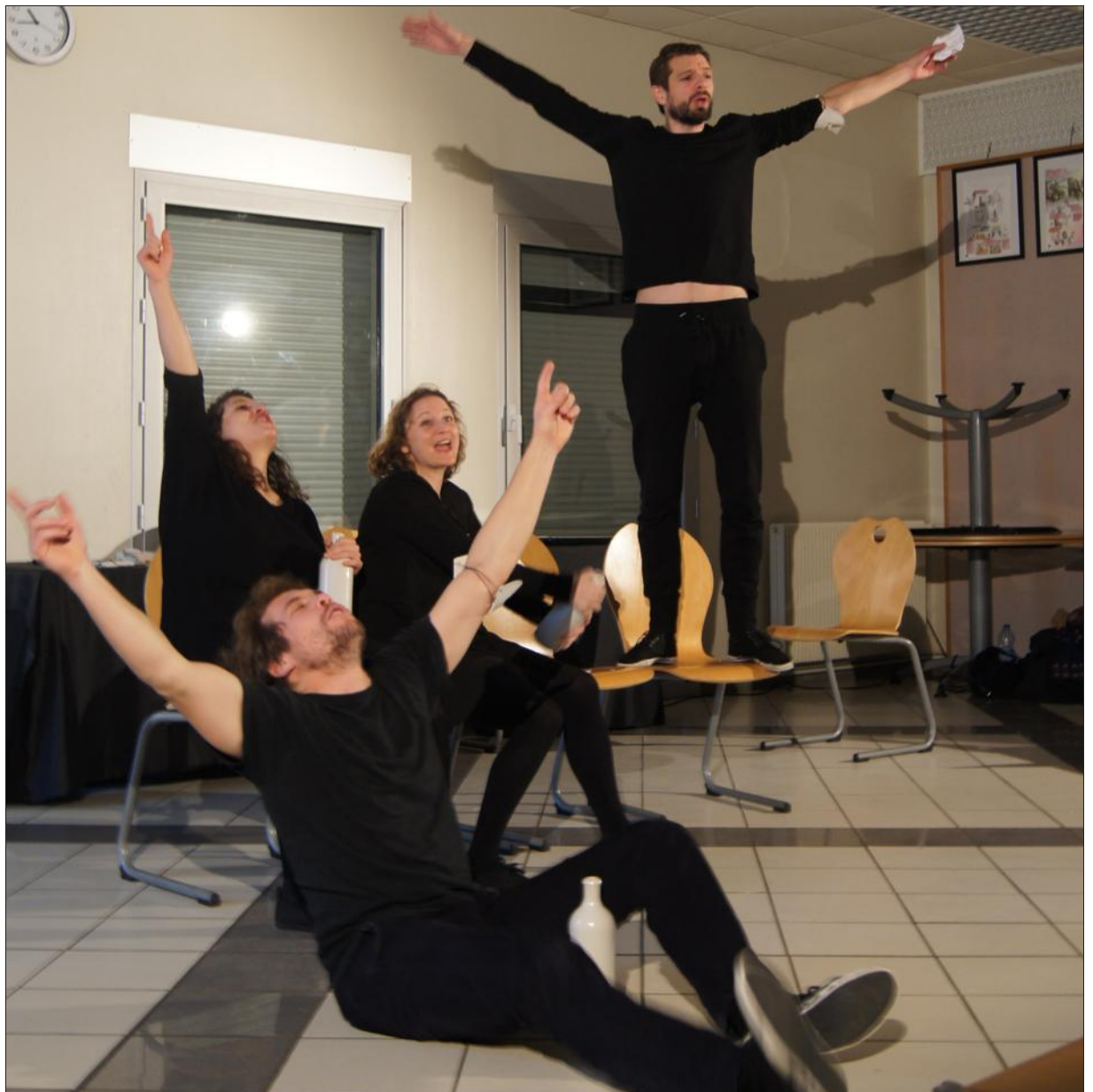
■ Des scènes de la vie quotidienne ont illustré les thématiques.

CONTACT Tél. 06.65.76.48.43 ou sur loiseau monde@yahoo.fr